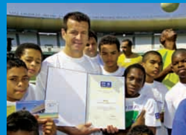
Carlos Dunga, ambasciatore FIFA per SOS Brasile con i bambini di Jacarepaguá e Pedra Bonita

Dall'inizio del mese di maggio SOS Brasile può contare su un nuovo ambasciatore FIFA per la promozione della campagna "6 villaggi per il 2006": Carlos Caetano Bledorn Verri, in arte "Dunga". Il capitano della nazionale brasiliana vincitrice dei Mondiali di Calcio del 1994, ha