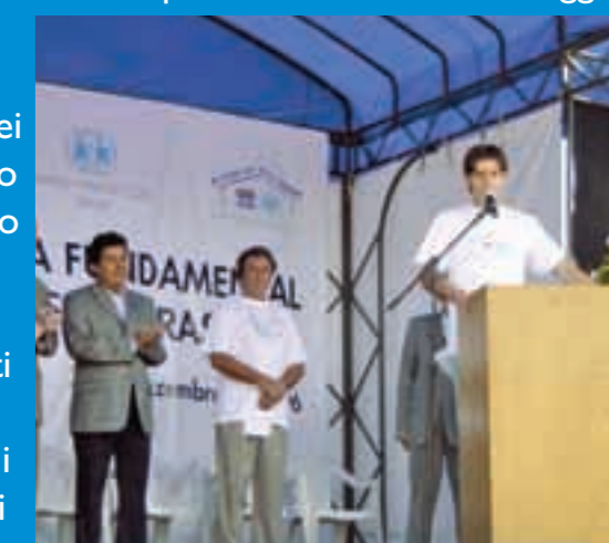
Cerimonia di inaugurazione dei lavori del Villaggio di Recife.

Il Villaggio, iniziato nel dicembre 2005, verrà terminato entro dicembre 2006 ed accoglierà 130 bambini in 14 famiglie, mentre un centro sociale esterno assisterà le famiglie, prevenendo quindi l'abbandono dei loro bambini.