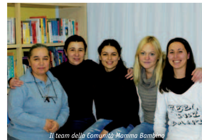
Il team della Comunità Mamma Bambino

Le educatrici SOS sono sempre presenti nella vita delle mamme e, soprattutto nella fase iniziale, suggeriscono tempi e modi d'azione: insegnano loro a lavare il bambino, come parlargli se piange, insomma a occuparsi di lui, a leggere i suoi bisogni e a rispondere adeguatamente. Ma non si sostituiscono mai alla mamma. Invece valutano la sua capacità di apprendimento e cercano di capire se esista o meno l'attaccamento al bambino.